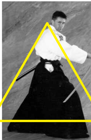
L.u.K. Martial Art System